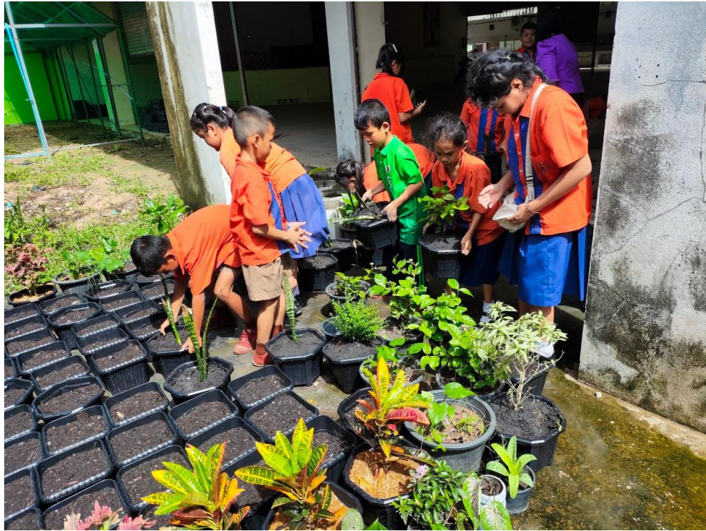
๓. การดูแลต้นไม้ในเรือนเพาะชำ นักเรียนช่วยกันรดน้ำ พรวนดิน ใส่ปุ๋ยต้นไม้ อย่าง